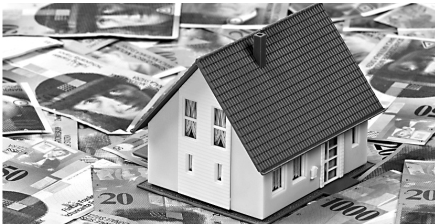
Bausparen hilft jungen Familien zum Eigenheim

An der Präsidentenkonferenz des Schweizerischen Verbandes für Seniorenfragen (SVS) vom 7. November 2011 in Zürich, beleuchteten 5 Referenten aus unterschiedlichen Blickwinkeln die pendenten Volkssinitiativen «Bausparen» und «Sicheres Wohnen im Alter».